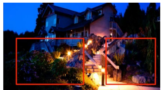
Eingeschalteter Contrast Enhancer